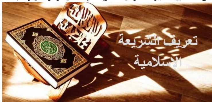
تعريف الشريعة الإسلامية

من أجل تعريف الشريعة الإسلامية لابد التطرق لتعريف اللغوي والإصلاحي (الفرع الأول)، ثم تعريف التشريع الجنائي الإسلامي من خلال بيان الجزء القانوني للشريعة الإسلامية وهو ما يعرف بالفقه الإسلامي.