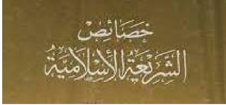
خصائص الشريعة الإسلامية

بمأن التشريع الجنائي الإسلامي هو فرع من فروع التشريع الإسلامي فإنه يتميز بنفس خصائص وسميات التشريع الإسلامي، حيث يتميز هذا الأخير بالعديد من السمات والخصائص منها: